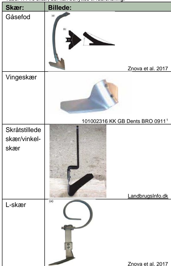
Tabel 1: Fire skær, der kan benyttes til radrensning.

Vingeskæret kendes mest fra stubharvning, og jordbearbejdningen er ofte for voldsom til rensning af rækkedyrkede afgrøder. Til radrensning kan vingeskæret bruges ved større rækkeafstand som midterste skær i rensesektionen i