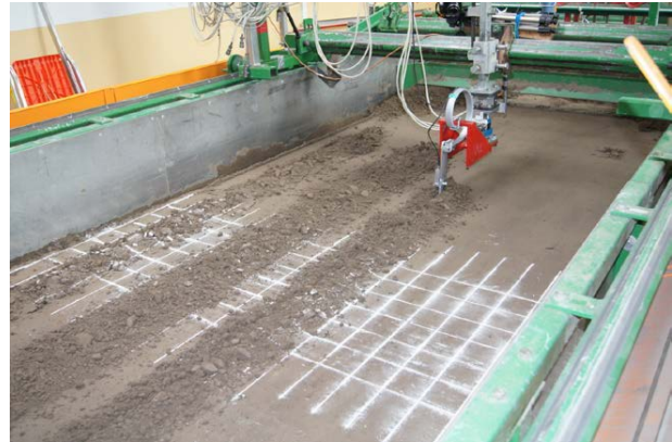
Billede 3: Laboratorieforsøg fra Warswa University of Life Science i Polen, hvor gåsefodsskær og AgrolIntellis nye L-skær sammenlignes.