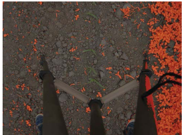
Billede 2: Vha. fotoanalyse blev mængden af ukrudt vurderet. Detekteret ukrudt er markeret med orange.

Ifølge nye studier foretaget af Agrolntelli i regi af projektet NEWCUT 3 , som er publiceret af Znova et al. (2017), har radrensning med et nyt Agrolntelli-produceret L-skær den fordel, at der kræves mindre trækraft end ved radrensning med et almindeligt gåsefodsskær. Dermed ser der ud til at være en økonomisk gevinst at hente i form af en brændstofbesparelse. L-skæret afsætter også færre kræfter ind i rækken, så afgrøden påvirkes mindre af jordbehandlingen. Målingerne er foretaget med en ny metode i et laboratorie på Warsaw University of Life Science i Polen (se billede 3), hvor der kan måles trækkræfter og jordbevægelse. I forsøget sammenlignes L-skæret med et almindeligt gåsefodsskær. Du kan se en video af forsøget og dets resultater